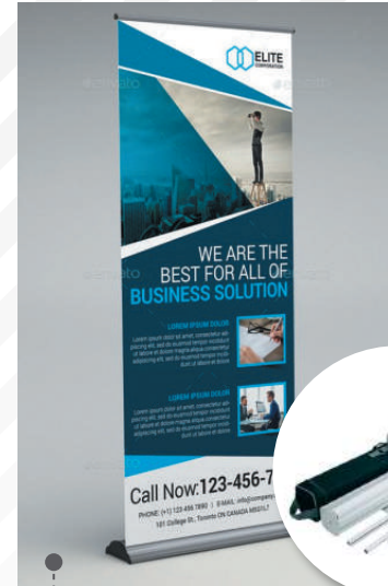
• ROLL SCREEN PREMIUM