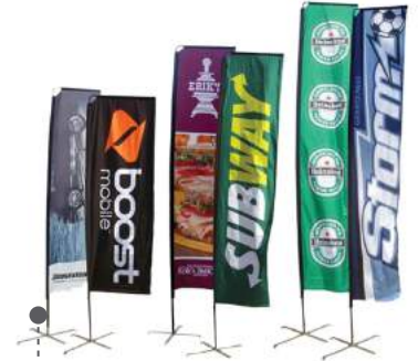
• BANDERAS VELA (FLAGS POLE) 2M, 3M, 4M Y 5M