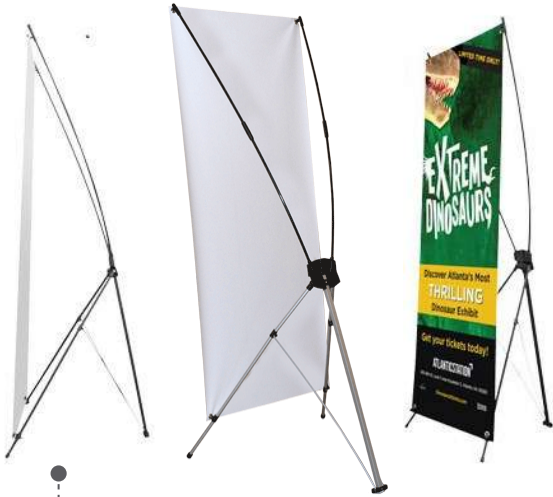
• SUPER ECO XB-D (BANNER STAND)

SISTEMA DE IMPRESIÓN DIGITAL 1400 DPI. TINTAS ORIGINALES, DISPLAYS / GIGANTOGRAFÍAS: 11 O 13 ONZ. TUBOS LISTONES DE MADERA TERMO SELLADO A AMBOS LADOS / VINILES LAMINADOS / INSTALACIONES