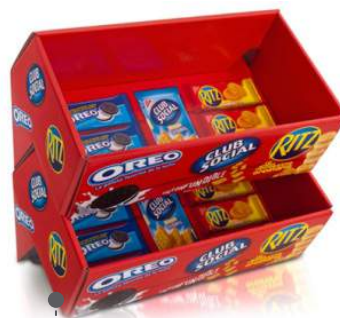
• DISPENSADOR DE MOSTRADOR