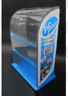
EXHIBIDORES DE PRODUCTOS