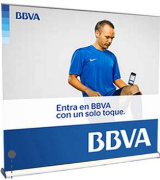
• ROLL SCREEN EXTRA WIDE