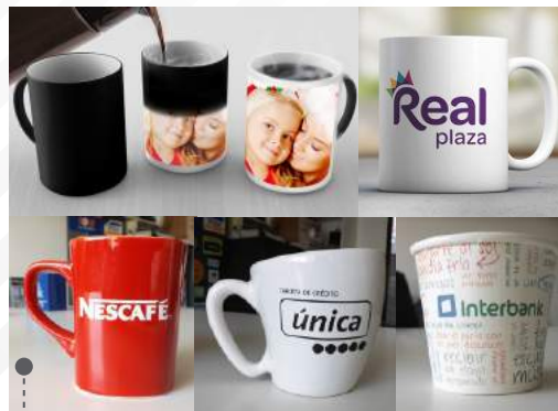
TAZAS: DISEÑOS PERSONALIZADOS SISTEMA DE IMPRESIÓN SUBLIMADO / SERIGRAFÍA