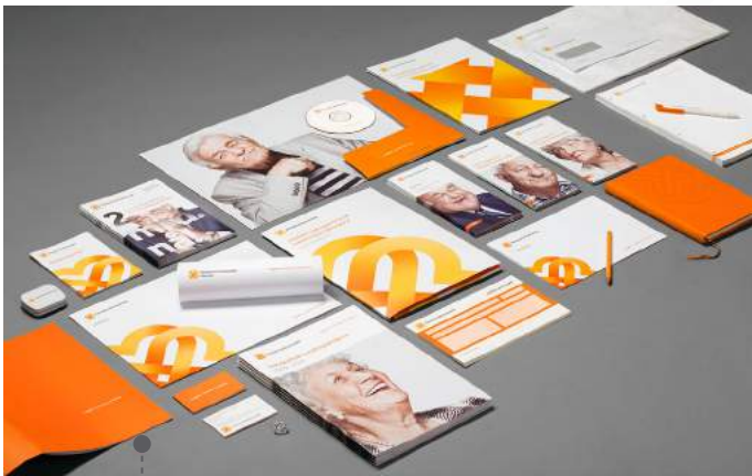
IMAGEN CORPORATIVA / BRANDING