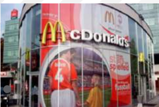
• VINIL ADHESIVO PUBLICITARIO