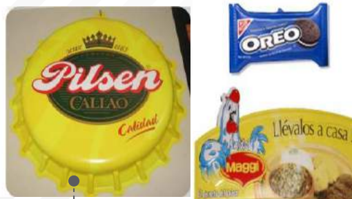
• AFICHES TERMOFORMADOS