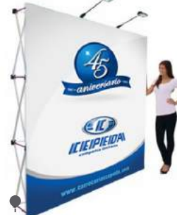
• BACK BOARD RECTO