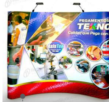
• BACK BOARD CURVO