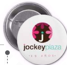
PINES, PRENDEDORES LLAVEROS DESTAPADOR ESPEJO / IMÁN 55 MM, 75 MM, 90 MM