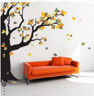
• VINIL ADHESIVO DECORATIVO