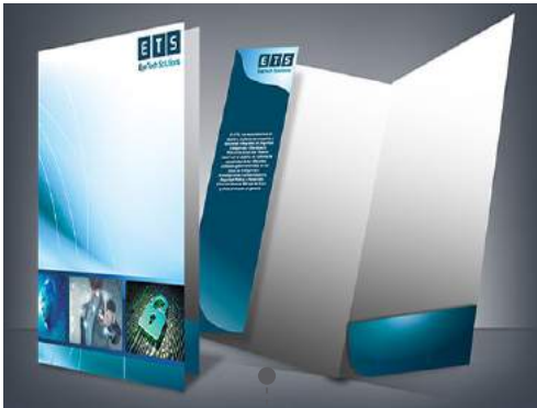
FOLDERS / FOLLETOS / VOLANTES