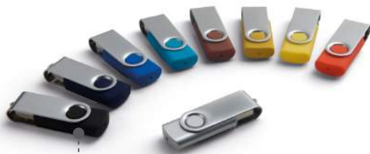
USB 4GB / 8GB / 16GB / 32GB USB LLAVERO METÁLICO, USB LLAVE