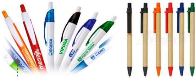
LAPICEROS: ECOLÓGICOS, METÁLICOS, PLÁSTICOS.