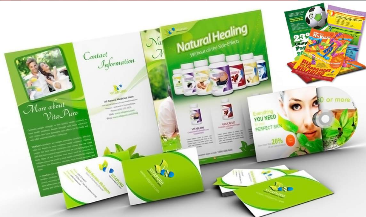
IMAGEN CORPORATIVA - PAPELERÍA DÍPTICO / TRÍPTICOS / FLYERS / VOLANTES AFICHES EN PAPEL - CARTÓN COLGANTES DE CARTÓN JALAVISTAS DE CARTÓN CAJAS DE CARTÓN AGENDAS PUBLICITARIAS CARPETAS PUBLICITARIAS CUADERNOS CORPORATIVOS PIONES / CARPETAS DE CUERO AGENDAS ANUALES BOLSAS DE PAPEL STICKERS