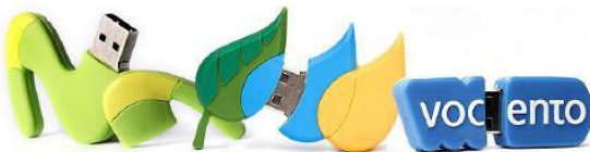
USB: DISEÑO, FABRICACIÓN DE MODELOS MARCAS