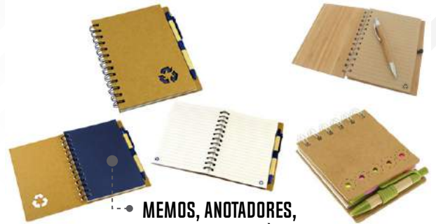
MEMOS, ANOTADORES, CUADERNOS ECOLÓGICOS