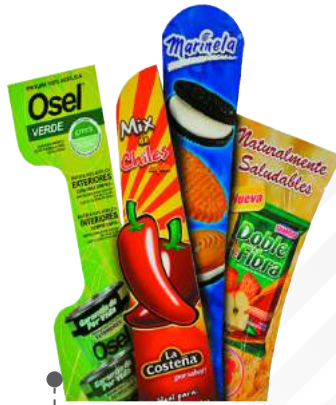
• ROMPETRÁFICOS O STOPPER