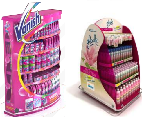
• DISPENSADORES EXHIBIDORES