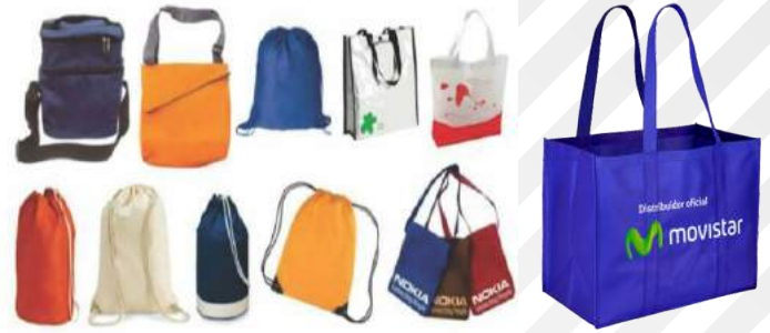
MORRALES, BOLSOS, BOLSAS ECOLÓGICAS BIODEGRADABLES