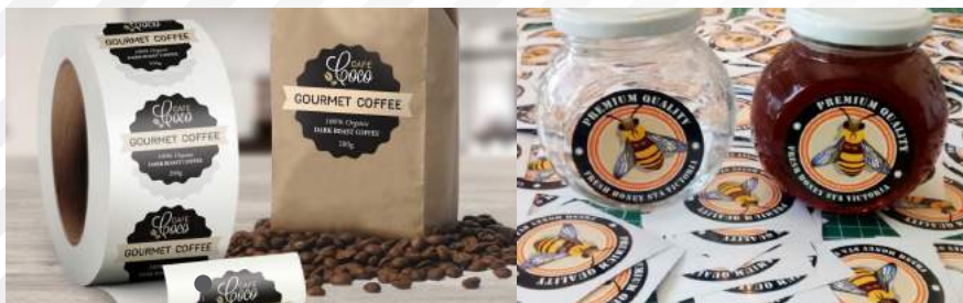
ETIQUETAS PAPEL / ADHESIVAS DE MARCAS