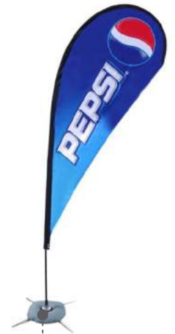
• FLYING BANNER DE 1.80 / 3M / 4M