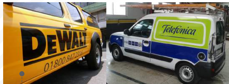
• VINIL ADHESIVO CON ROTULACIÓN DE LOGOTIPOS / LETRAS