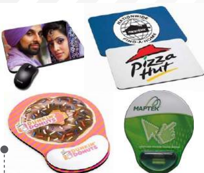
MOUSE PAD DISEÑOS PERSONALIZADOS / ERGONÓMICOS