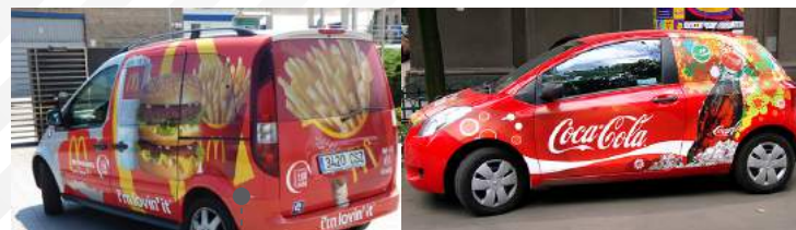
• VINIL ADHESIVO MOLDEADO