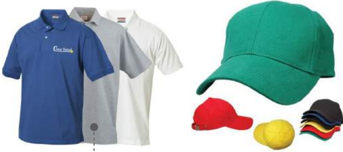
POLOS Y GORRAS BORDADOS EXCLUSIVOS