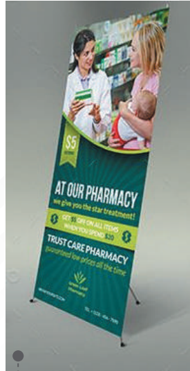
• CXB4 BANNER STAND