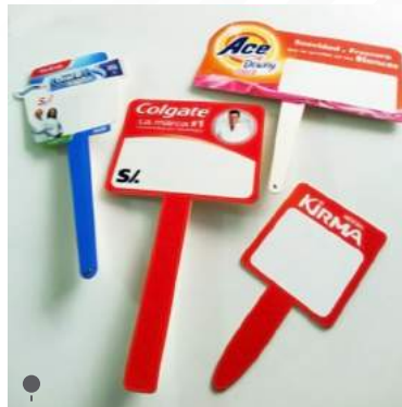
• MARCADORES DE PRECIO