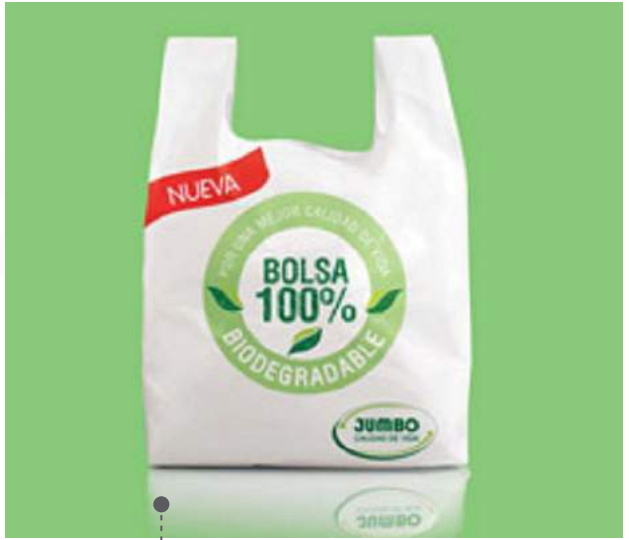
• BOLSAS BIODEGRADABLES