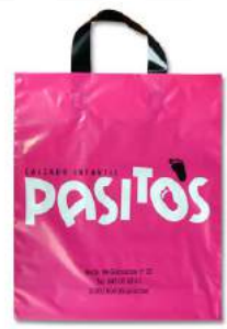
• BOLSA ASA PLUS FLEXIBLE