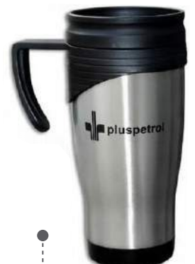
MUGS / TERMOS