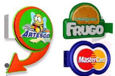
• BANDEROLAS TERMOFORMADAS